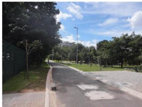
Parque das Bicicletas: Liberado para a PMSP