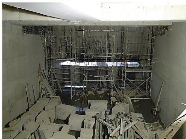
Túnel de interligação da Linha 5-Lilás.