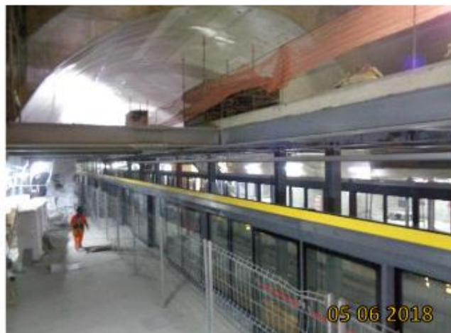
Corpo da Estação : Portas de Plataforma (Header Box e Vidros) em instalação.