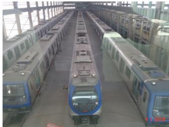
Trens da frota P e F estacionados no Bloco A do Pátio Guido Caloi.