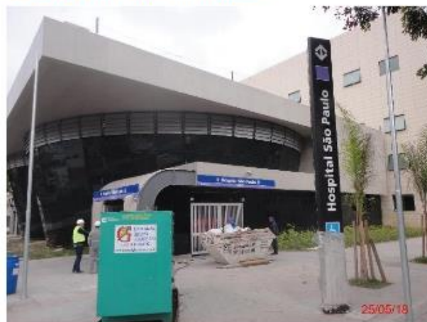
Acesso Sul: Vista geral