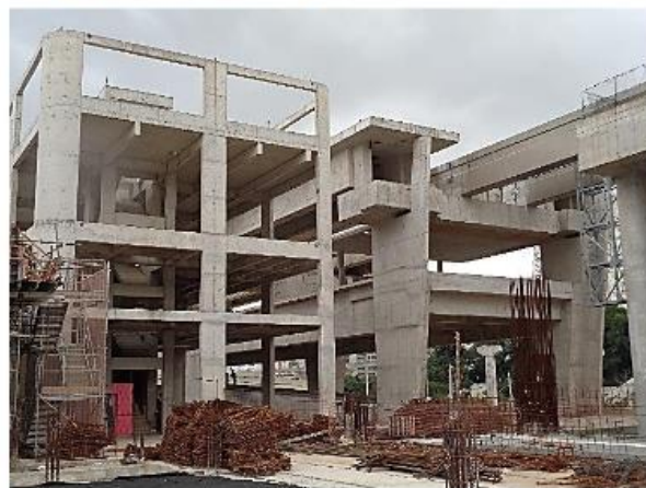
Edifício Operacional e Corpo da Estação (esta estação possui plataformas laterais) – Obra Bruta concluída.