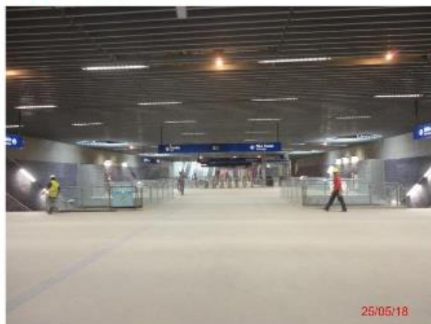
Mezanino: Implantação dos sistemas