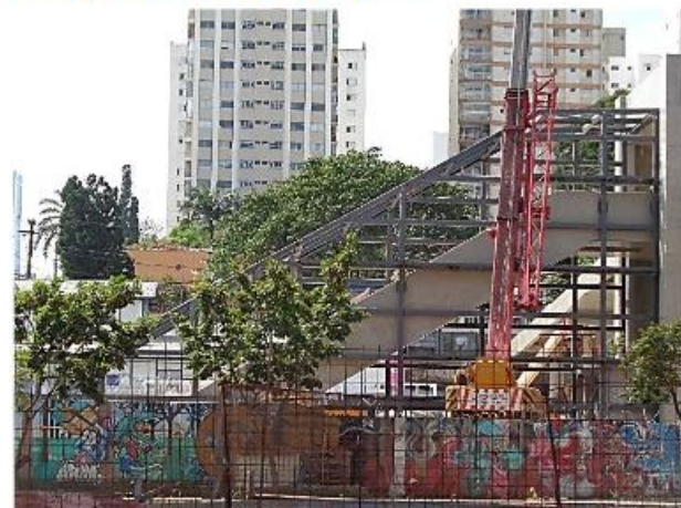
Montagem da estrutura metálica do acesso da Estação.