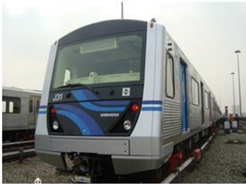
Linha 1 - Azul