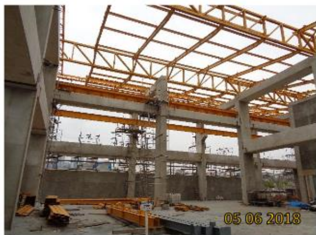
Bloco F: Cobertura Metálica em execução.