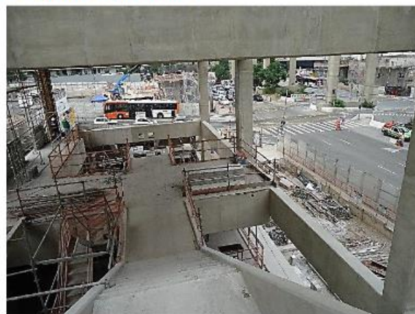
Trecho da Interligação Linha 17 x Linha 5