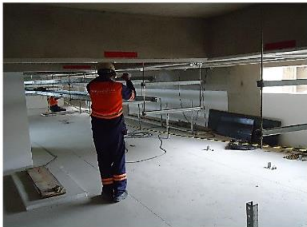
Execução do bandejamento de cabos