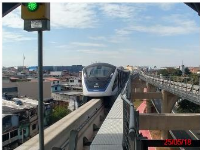
Trem em operação chegando na Estação Vila União.