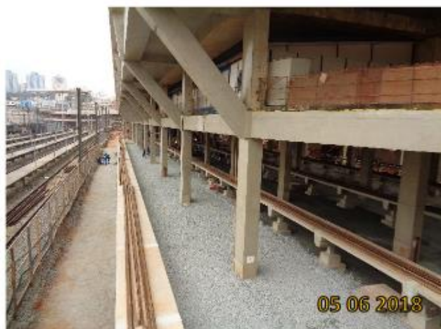
Nível Pátio (Terminal de Ônibus Vila Sônia): Plataformas de acesso aos trens e reaterro em execução. Infraestrutura para rede aérea em instalação.