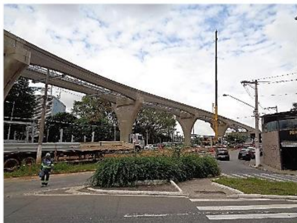
Lançamento da passagem de emergência.