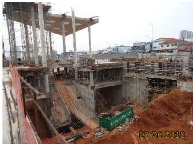
Acesso Heitor dos Prazeres: cobertura da estação e estruturas internas do acesso.