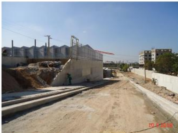
Viário em execução.