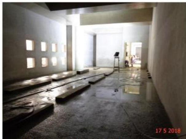
Salas Técnicas: Contrapiso em execução