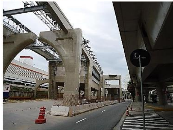
Corpo da Estação