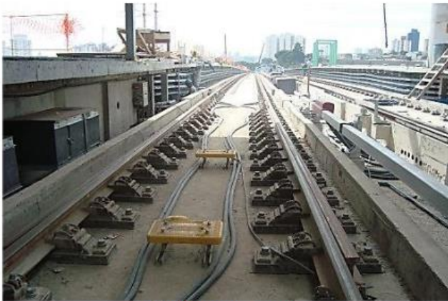
Equipamentos na via