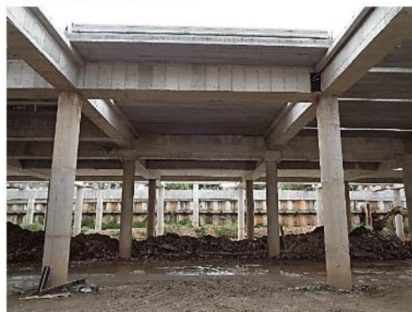
Execução da laje sobre o piscinão.