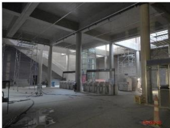
Mezanino Superior: Implantação dos sistemas