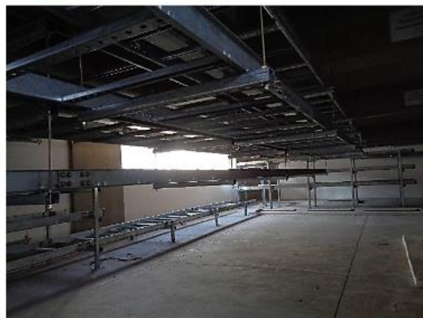
Instalação do bandejamento