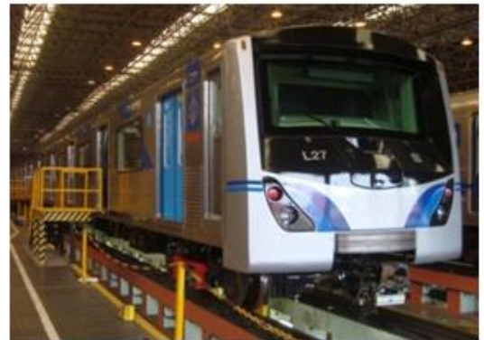
Linha 3 - Vermelha