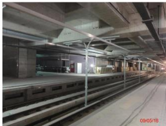
Plataformas: Fase final de acabamento