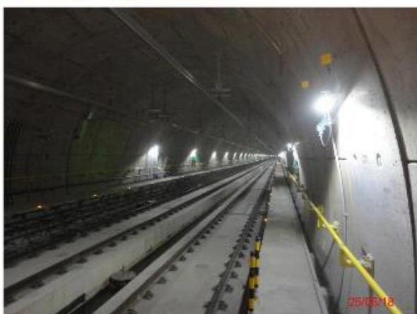
Trecho Hospital São Paulo – Santa Cruz: Concluída via permanente